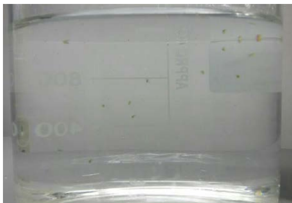
Figura 03: Organismo teste.

Durante a semana foi realizado as trocas de água dos recipientes de cultivo e limpos com álcool 70%. Para coleta dos organismos utilizou-se duas redes de aço-inox de malha de 1 mm e outra de 0,2 mm, onde a primeira foi retidos os organismos adultos (matrizes) e a segunda para coletar os organismos jovens. Após as trocas, as matrizes retornaram ao cultivo climatizado, e os jovens entre 2 e 24h de vida foram utilizados para o teste.