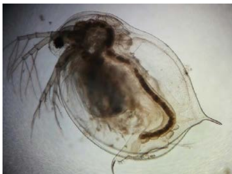
Figura 02: Organismo-teste Daphnia magna adulta (40X).

As daphnias se reproduzem de dois modos: sexuado e assexuado. Em condições ótimas, tais como fotoperíodo de 16 horas e temperatura de 20°C as fêmeas se reproduzem de forma assexuada, sendo produzidas daphnias idênticas às suas progenitoras. Quando submetidas a condições diferentes desse padrão podem gerar machos de Daphnia magna (FLINKER, 2002).